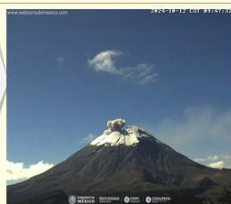
Imagen destacada de las últimas 24 horas

CON LA PARTICIPACIÓN DEL INSTITUTO DE GEOFÍSICA DE LA UNAM